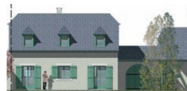
Lot 4 : façade sud