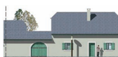
Lot 4 : façade nord